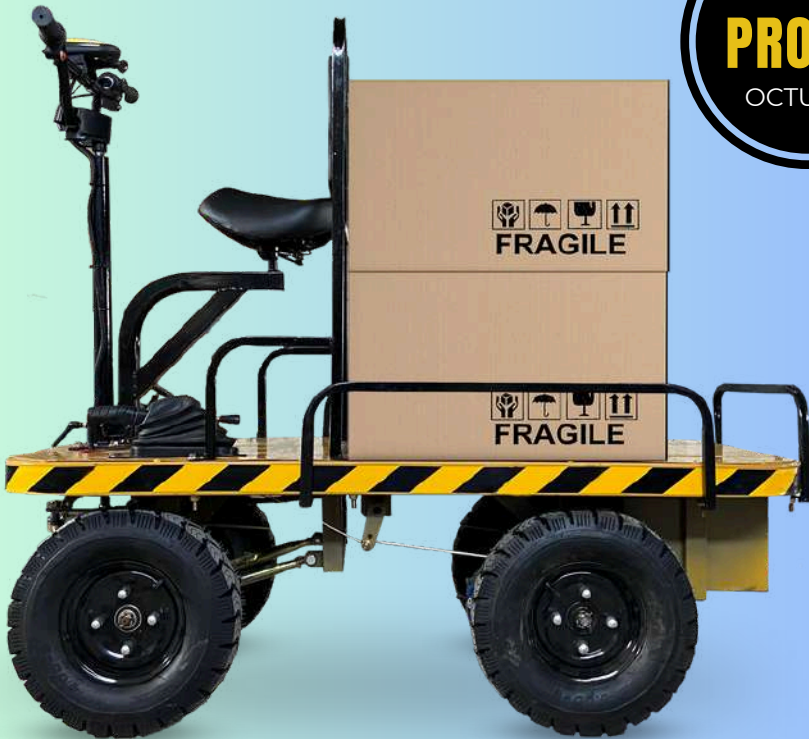
Imágen referencial | Equipado con ruster