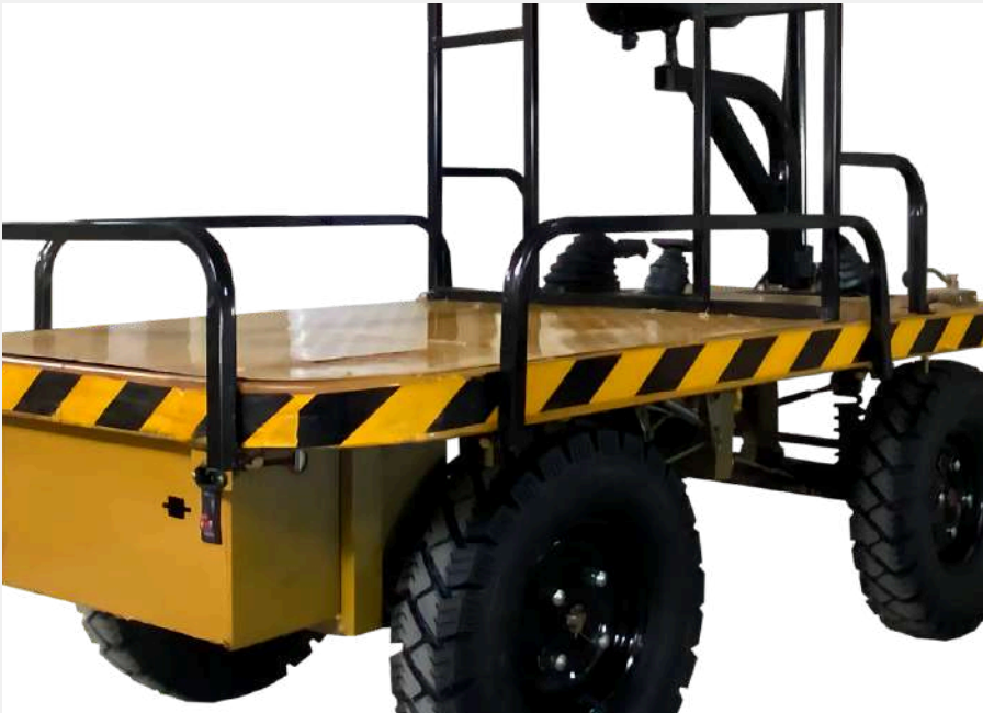
Consultar colores diponibles