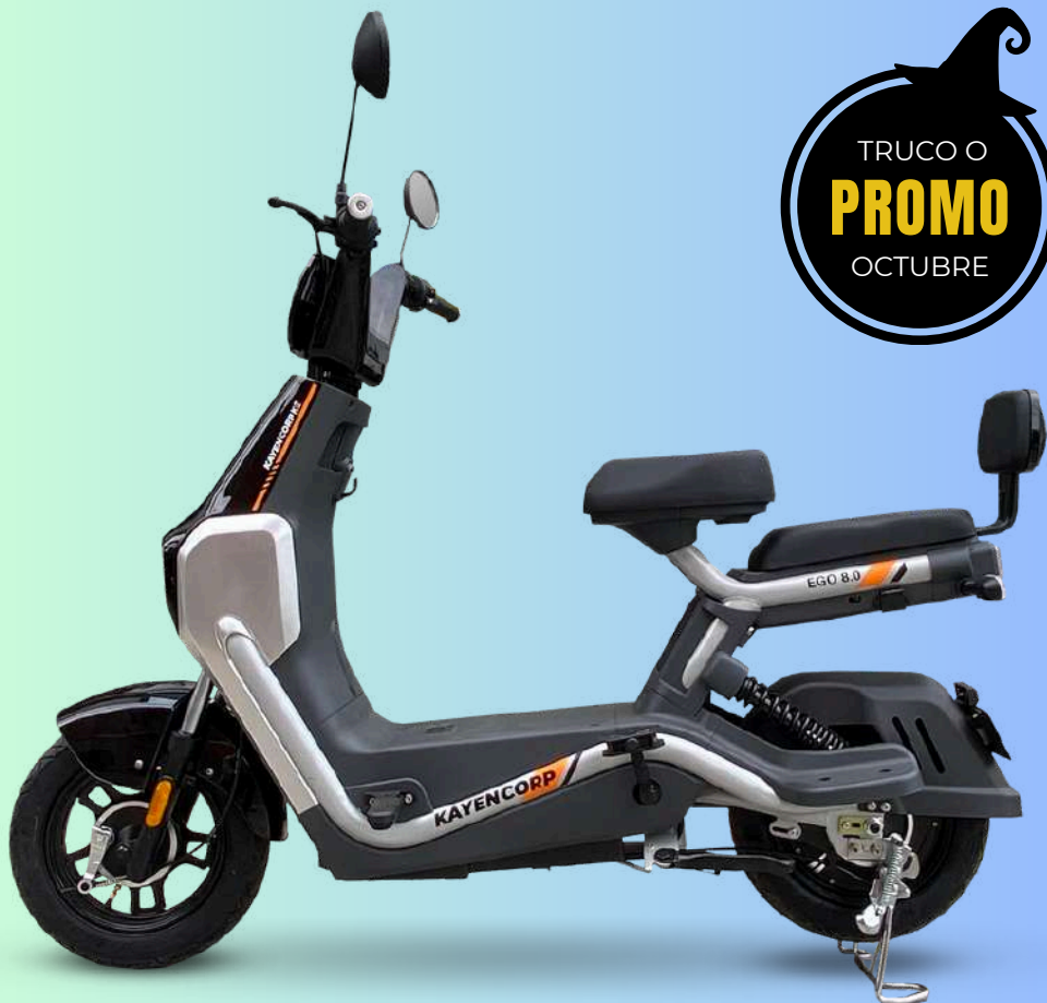
No requiere SOAT, placa ni licencia | Imágen referencial