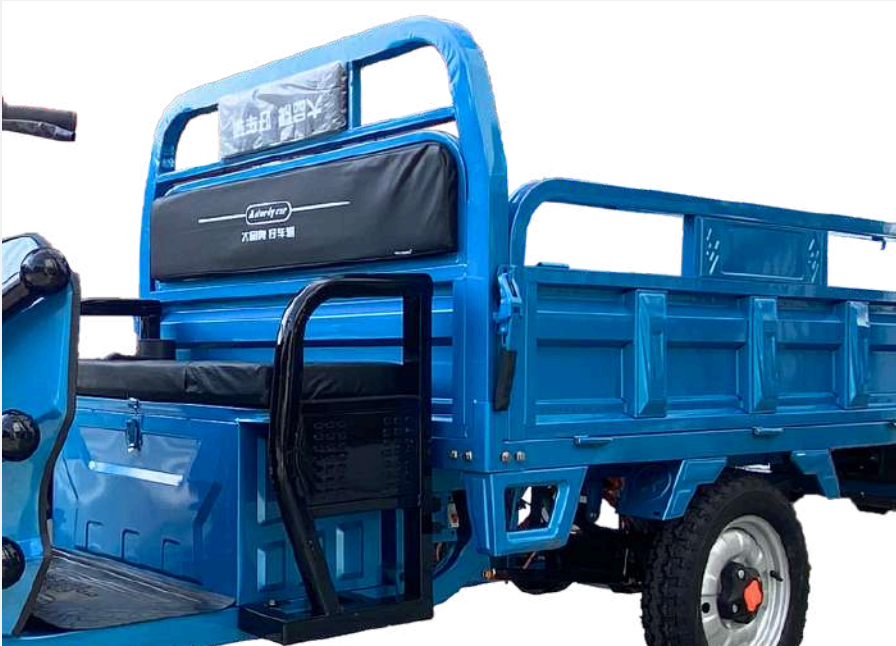
Consultar colores disponibles