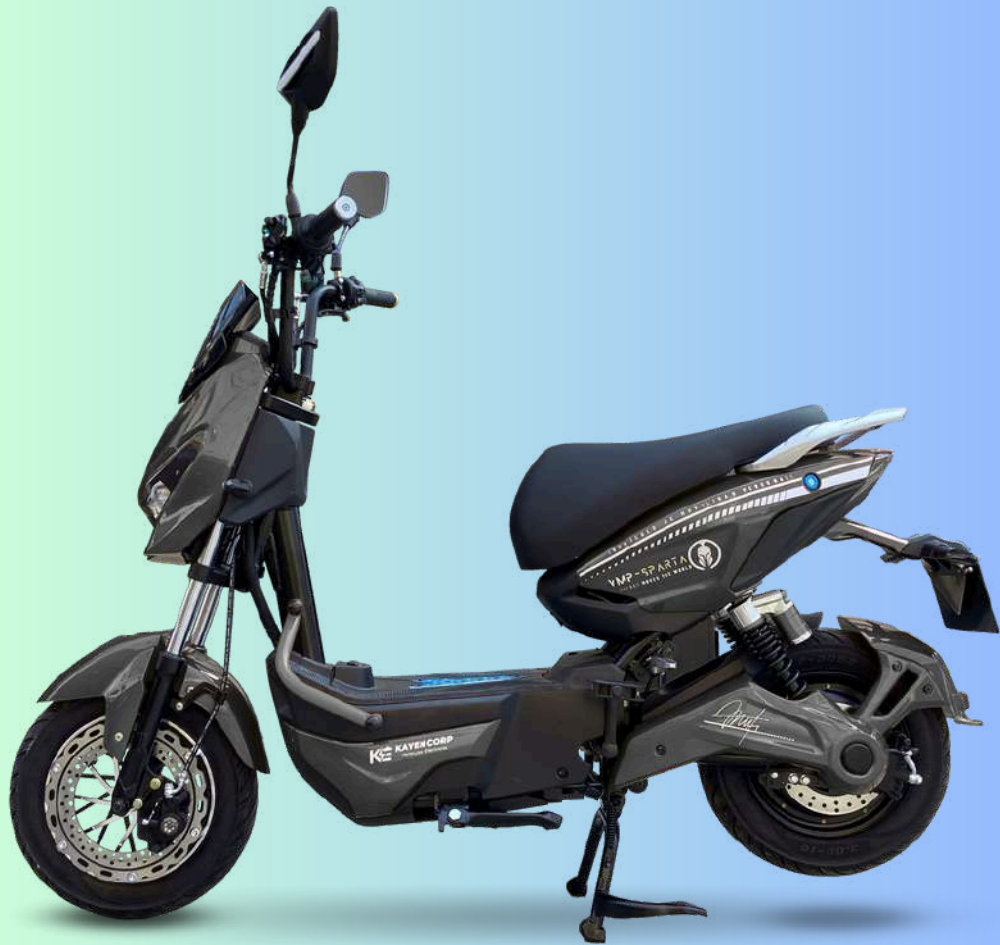
No requiere SOAT, placa ni licencia | Imágen referencial