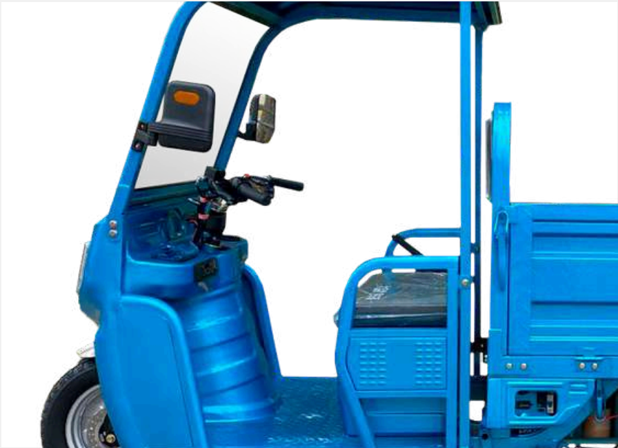
Consultar colores disponibles