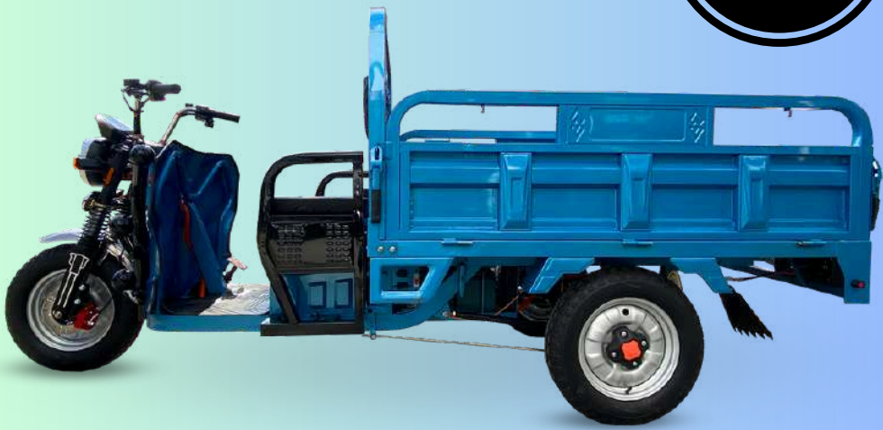
Imágen referencial | Equipado con ruster